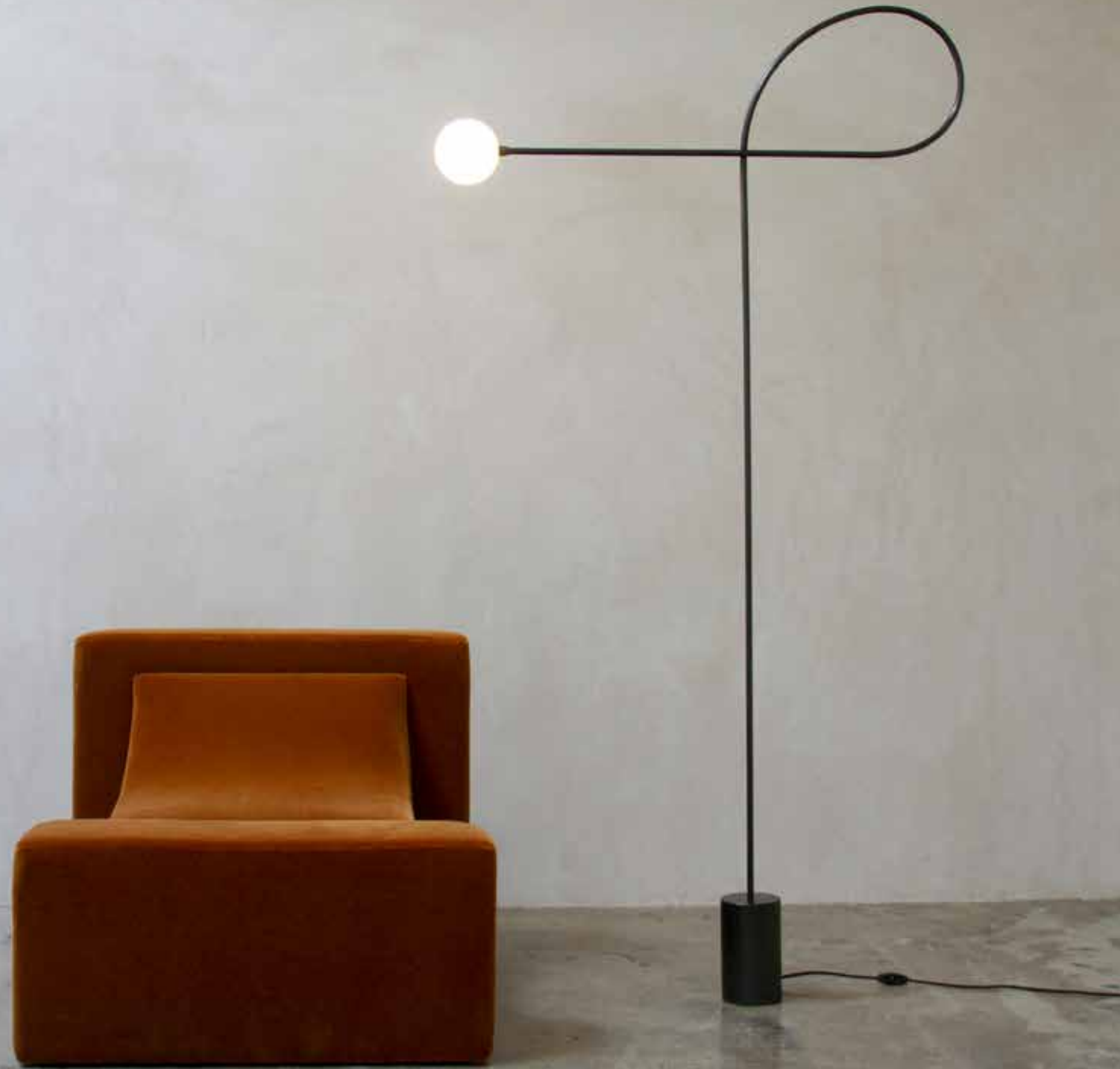
Vloerlamp Bow van staal en mondgeblazen glas, in zwart staal of messing, Estudio Persona (€ 2285).